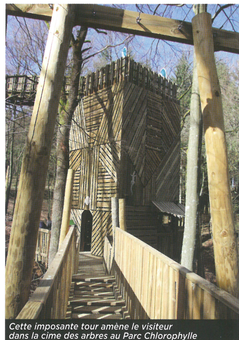
Cette imposante tour amène le visiteur dans la cime des arbres au Parc Chlorophylle