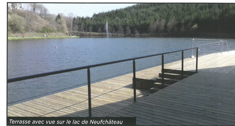
Terrasse avec vue sur le lac de Neufchâteau

Il y a aussi des chantiers privés. Lionel nous parle d'un chantier récent. « L'Auberge de la Ferme à Rochehaut nous a contactés pour qu'on conçoive un immense cochon de 10 mètres sur six dans lequel les enfants pourront jouer : le genre de challenge qui nous motive ! »