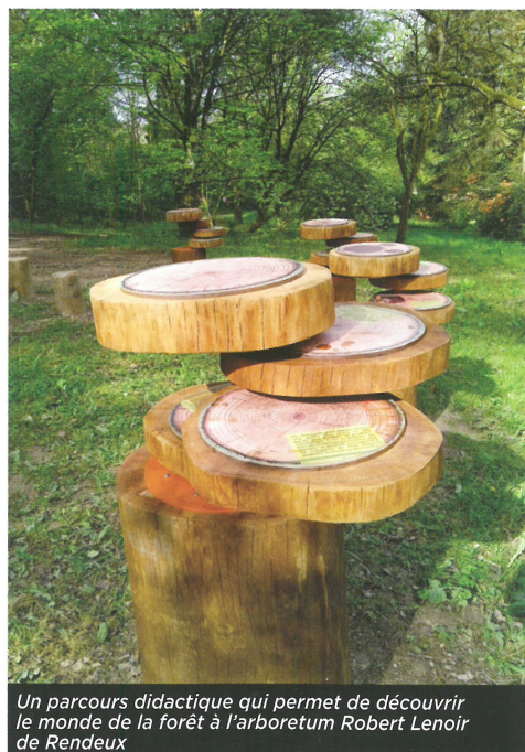
Un parcours didactique qui permet de découvrir le monde de la forêt à l'arboretum Robert Lenoir de Rendeux