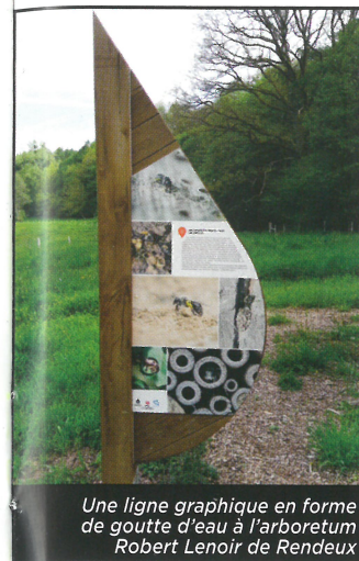
Une ligne graphique en forme de goutte d'eau à l'arboretum Robert Lenoir de Rendeux

« J'ai créé la Société en 1995 afin de développer le réel savoir-faire de valorisation du bois en Wallonie » nous explique-t-il. « Avant cette date, il existait très peu d'usinage