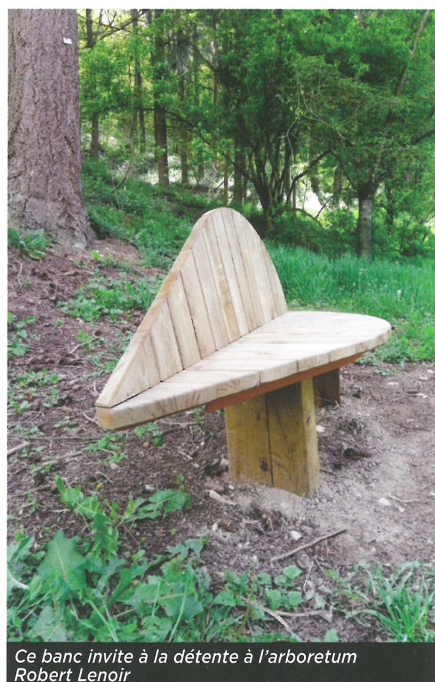
Ce banc invite à la détente à l'arboretum Robert Lenoir

« J'ai créé la Société en 1995 afin de développer le réel savoir-faire de valorisation du bois en Wallonie » nous explique-t-il. « Avant cette date, il existait très peu d'usinage